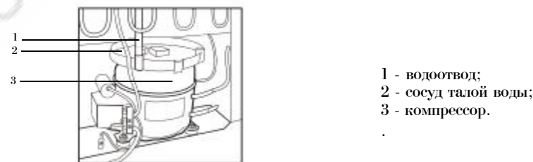
Рисунок Б.2 - Схема отвода талой воды из холодильной камеры.